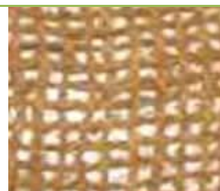
900 г/ м2

Растения легко прорастают сквозь геотекстиль, когда этот материал биологически разлагается, то он добавляет органические питательные вещества в почву