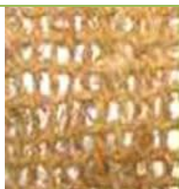
700 г/ м2